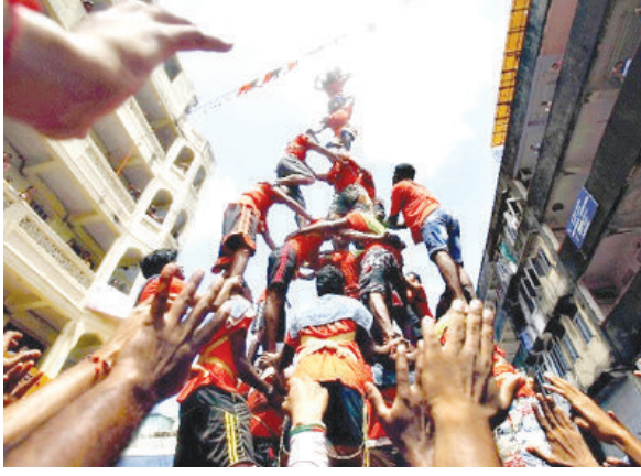
वाली मानव श्रृंखला की ऊंचाई अधिकतम 20 फीट रखने को

गौरतलब है कि यह मामला सुप्रीम कोर्ट में भी है, क्योंकि महाराष्ट्र सरकार ने हाई कोर्ट के उस आदेश को चुनौती दी है जिसमें दही हांडी पर बनने