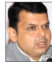
देवेन्द्र फडनवीस मुख्यमंत्री